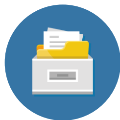
ARCHIVIO ISA 2018

Andamento della media dei ricavi/compensi (SOSE) Proiezione al 2019 sulla base delle Analisi dei microsettori Prometeia