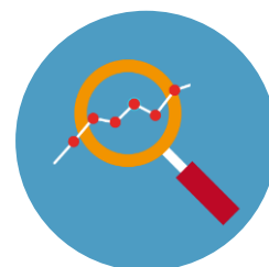
PROIEZIONE ISA 2019